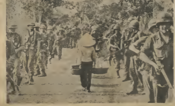
BISTA NA SUR-VIETNAM

Mannheim American den cercuna di nan base aereo na Da Nang, mienta cu algun dama di Sur Vietnam ta pasa tranquil hisa manera di soldadnan.